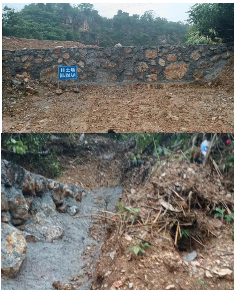
图 2-4 挡土墙及截排水沟设施