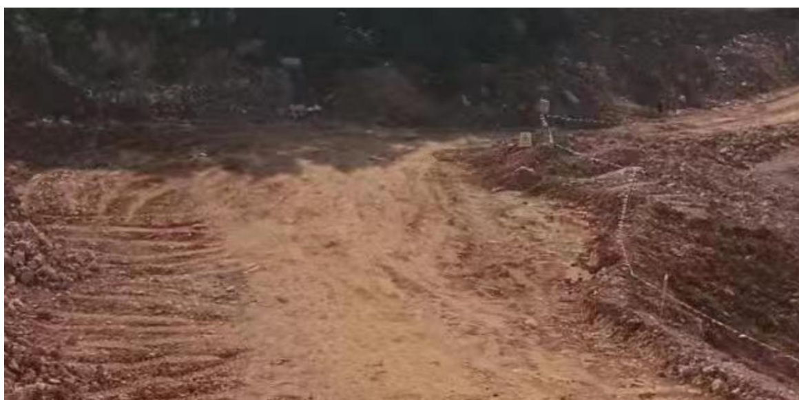
图 2-4 运输道路及安全车挡