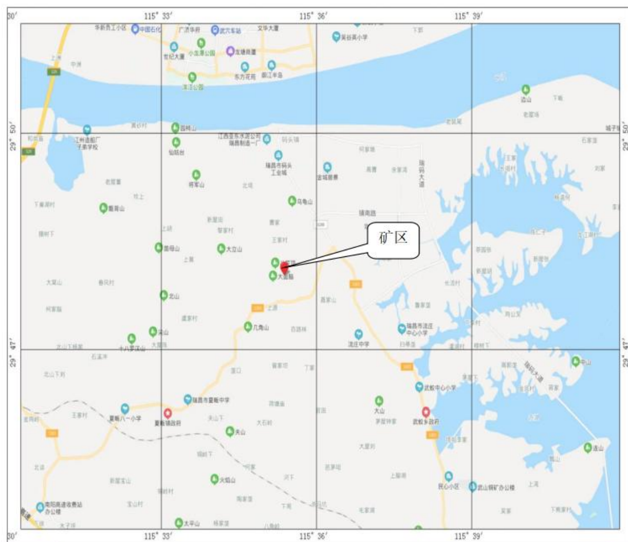
图例 1 2 3 4 5 6 7 8

1、矿区位置 2、铁路 3、国家级高速公路 4、省级高速公路 5、国道 6、省道 7、市行政中心 8、县行政中心