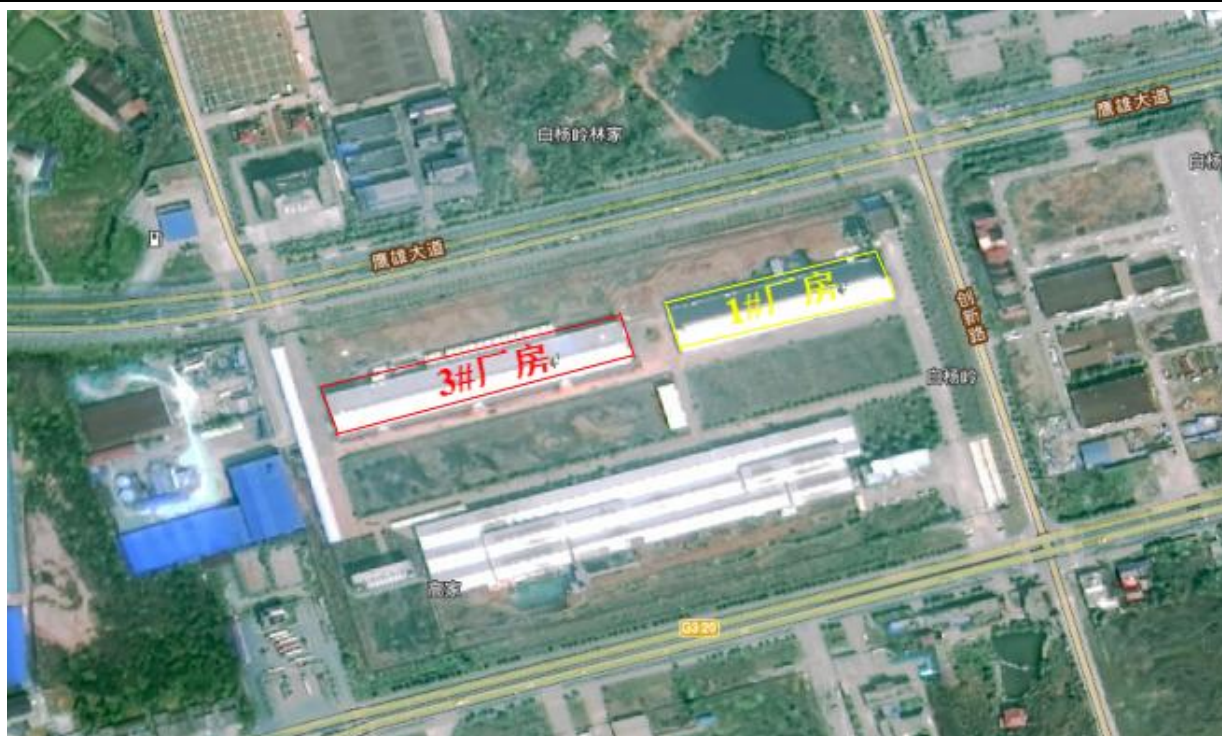
图 2.2.4-1 周边环境图