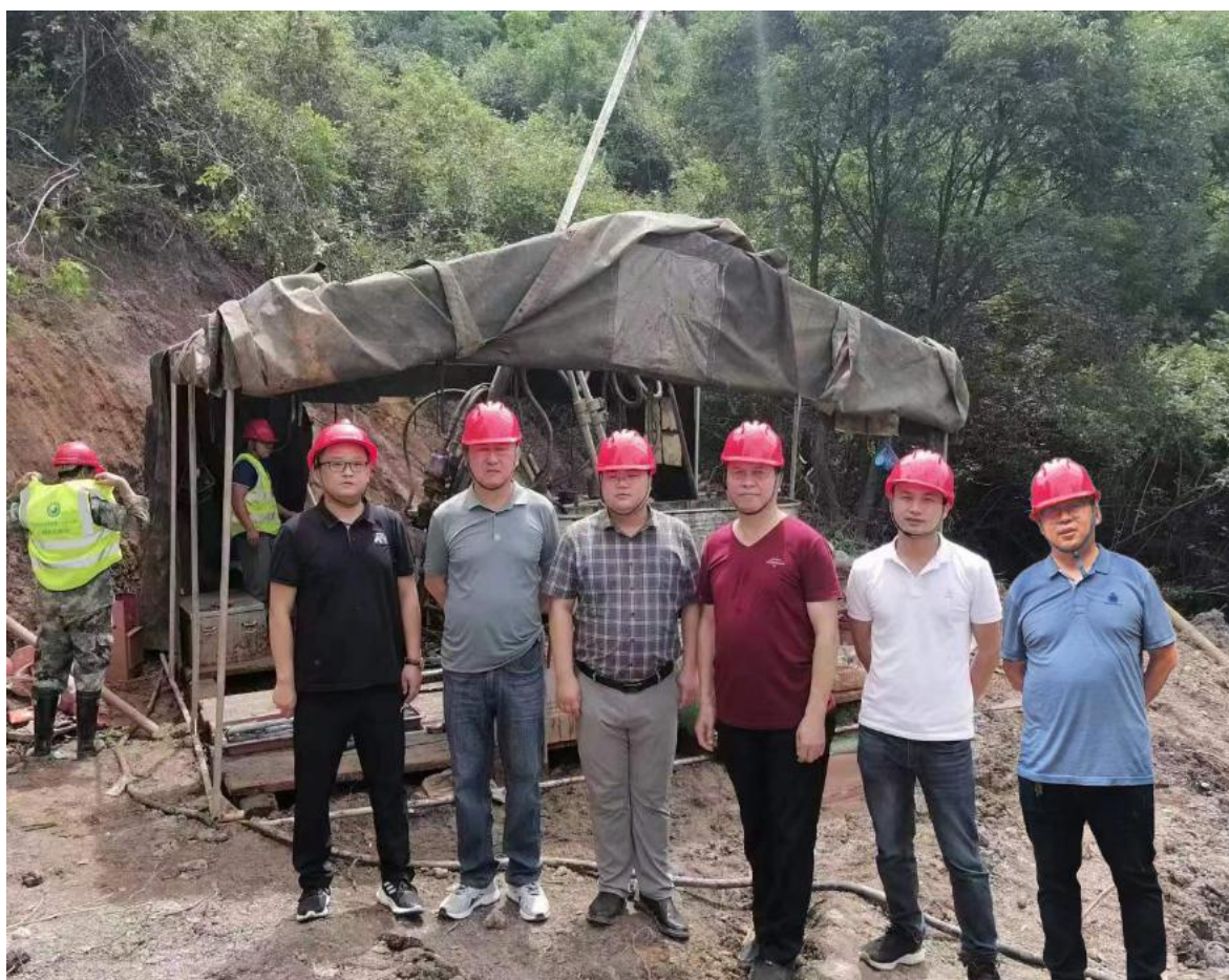
与江西省地质局第八地质大队安全管理人员合影