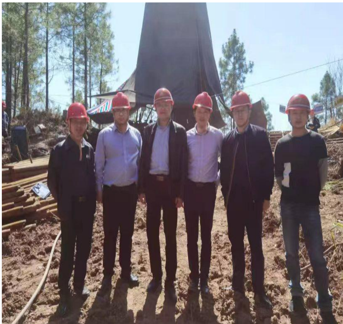
与江西省地质局第九地质大队安全管理人员合影